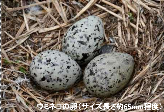
ウミネコの卵(サイズ長さ約65mm程度)